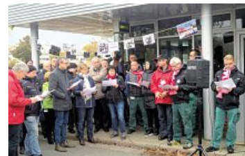
»Fünf vor zwölf« und »Ich bin Siemens« – Aktionen beim Siemens Generatorenwerk in Erfurt