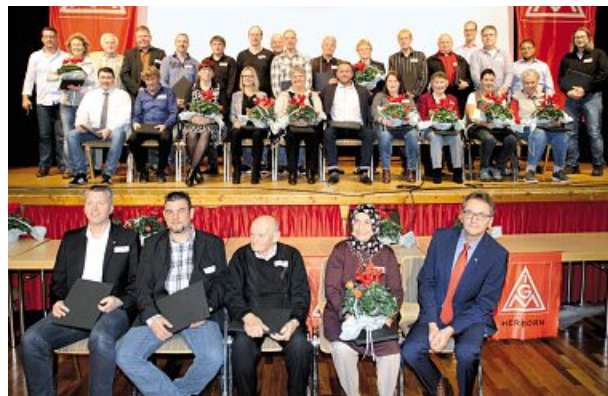
25 Jahre Mitgliedschaft