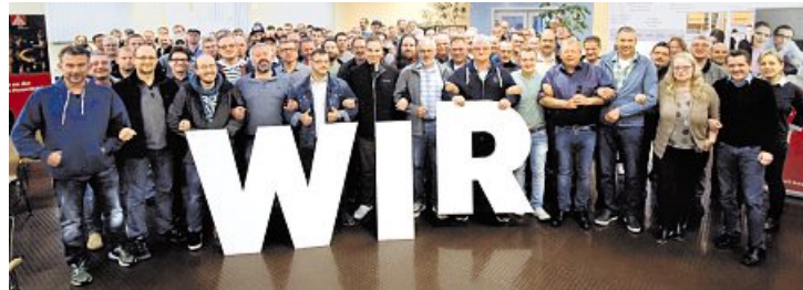
Stehen geschlossen hinter ihren Forderungen: die IG Metall-Mitglieder bei DFH Haus

Über 150 Mitglieder kamen in Rheinböllen in der Kantine der Firma Continental-Teves zusammen, um ihre Forderungen aufzustellen. Bis es soweit kommen konnte, war es ein langer und steiniger Weg, der auch von manchen Rückschlägen geprägt war. Letztlich jedoch haben sich die Metallerinnen und Metaller nicht unterkriegen lassen. Jetzt soll es schnellstmöglich einen Haustarifvertrag für DFH Haus in Simmern geben.