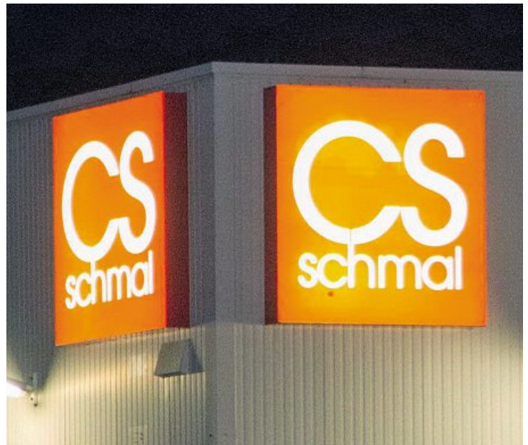
Steht still: CS Schalmöbel

Die Stimmung in der Belegschaft wurde allerdings jäh getrübt, als im Spätsommer dieses Jahres erstmals die Zahlung der Entgelte ins Stocken geriet. Anschließend bat die Geschäftsführung die IG Metall um Gespräche, ob die Beschäftigten »angesichts der Krisenlage« nicht