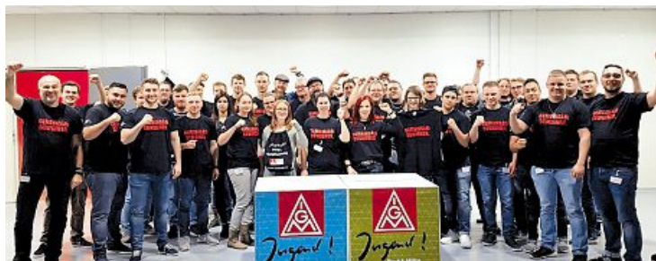
Unsere Delegation aus Mittelhessen