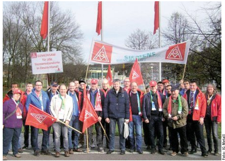
Thüringer Delegation zum Tarifauftakt in Zwickau