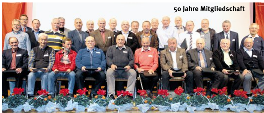
50 Jahre Mitgliedschaft

Gruppenfotos der anwesenden Jubilarinnen und Jubilare für 50-Jährige, 40-Jährige (mit Kabarettisten-Duo »Irmchen und Heinz«) und 25-jährige Mitgliedschaft