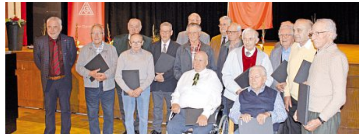
Eine besondere Ehrung wurde den Kollegen für 60-, 65- und 70-jährige Mitgliedschaft in der IG Metall zu teil.

82 Kolleginnen und Kollegen wurden für 25-jährige Mitgliedschaft geehrt, 61 für 40-jährige Mitgliedschaft und 19 für 50-jährige Mitgliedschaft. 9 Kollegen wurden für 60 Jahre Mitgliedschaft und 7 für 65-jährige Mitgliedschaft geehrt. 6 Kollegen gehören der Gewerkschaft seit 70 Jahren an.