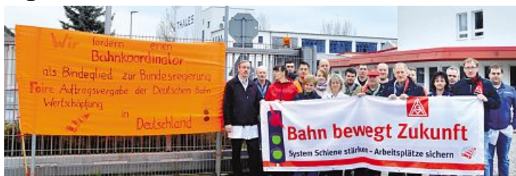
Dezentraler Aktionstag am 6. November bei Thales in Arnstadt

Die IG Metall-Betriebsräte in der Bahnindustrie haben eine gemeinsame Erklärung abgegeben. Darin heißt es vor dem Hintergrund der harten Restrukturierung bei Bombardier und dem Zusammenschluss der Bahnsparten von Siemens mit Alstom auch mit Blick auf die laufenden Koalitionsverhandlungen in Berlin: »Wir erwarten von den Unternehmen Strategien für ihre Standorte, für Investitionen in Fachkräfte und neue Produkte statt kleinkarier-