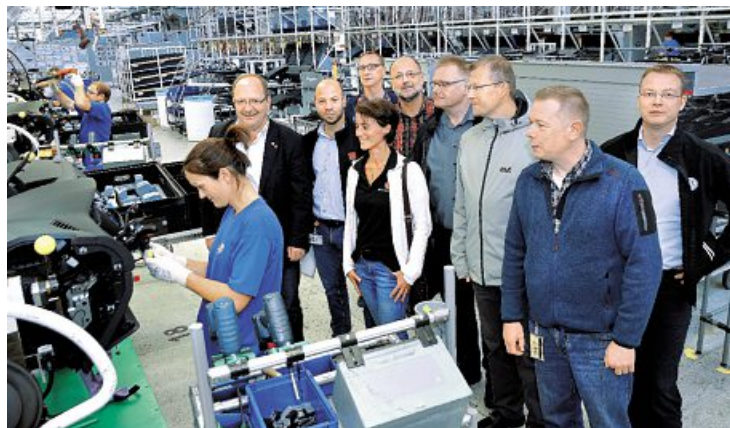
Conti-Betriebsräte besuchten die Cockpit-Montage bei VW in Wolfsburg.