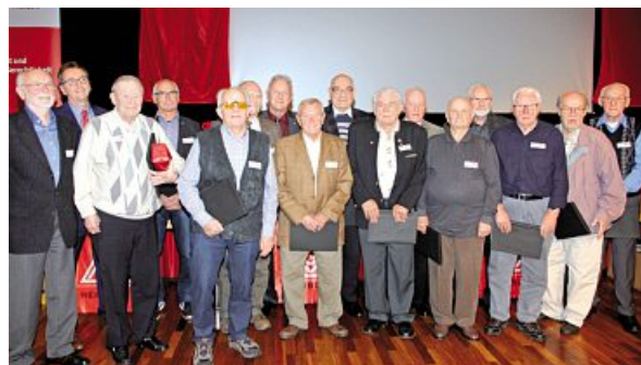
60 Jahre Mitgliedschaft