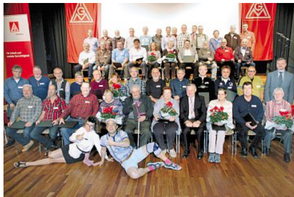
40 Jahre Mitgliedschaft

Gruppenfotos der anwesenden Jubilarinnen und Jubilare für 50-Jährige, 40-Jährige (mit Kabarettisten-Duo »Irmchen und Heinz«) und 25-jährige Mitgliedschaft