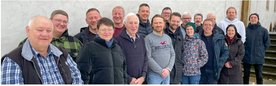
Unser aktueller Ortsvorstand bei der Klausur im Dezember 2023