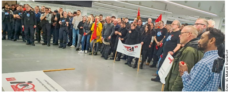
Protest auf der Betriebsversammlung

MERCEDES-BENZ Der Konzern prüft den Verkauf aller Niederlassungen.