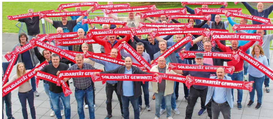
Die gute Arbeit ist ein Grund für den Mitgliederzuwachs. Eindruck von der Klausurtagung des Ortsvorstands 2023