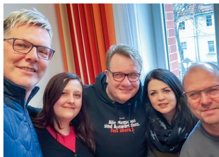
Ein Seminar, das den Teilnehmenden sichtbar Spaß machte.

»Es war eine super Woche«, brachte ein Teilnehmer seine Begeisterung zum Ausdruck und ergänzte: »Wir haben an