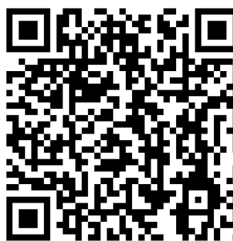
Aktuelle Entwicklung über den QR-Code

Melde Dich bei uns im Büro oder bei Deinen Vertrauensleuten, wenn Du genauere Informationen zur Anreise benötigst.