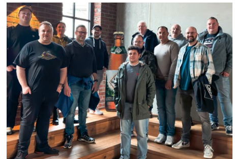
Seminarteilnehmer in der Hachenburger Brauerei.

Mehr Informationen zu regionalen Seminaren gibts auf br-akademie-mitte.de/ oder direkt bei der IG Metall Neuwied.