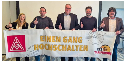
Die Tariffkommission tagte im Februar.

Dementsprechend beschloss die Tariffkommission für das Kfz-Handwerk Rheinland-Pfalz die Forderung von 6,5 Prozent mehr Entgelt sowie eine Steigerung der Ausbildungsvergütung um 170 Euro. Die Tarifverträge laufen zum